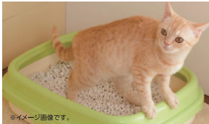
※イメージ画像です。